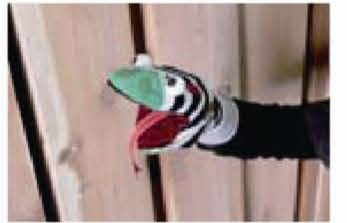
主催：わらび劇場 [第五回こまち演劇祭]

場 所：『手創る市』テントブース 時 間：10:00~12:00 参加費：500円 (材料費込) 予約+当日随時受け付け ※観劇料は別途 持ち物：簡単な裁縫道具をお持ち下さい