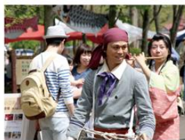
村の音楽会の様子