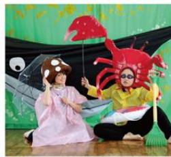
びっちゃん・ぼっちゃん